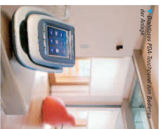
Drahtloses PDA-Touchpanel zum Bedienen der Anlage.

Als Bedienelemente kommen einfache, tradi-