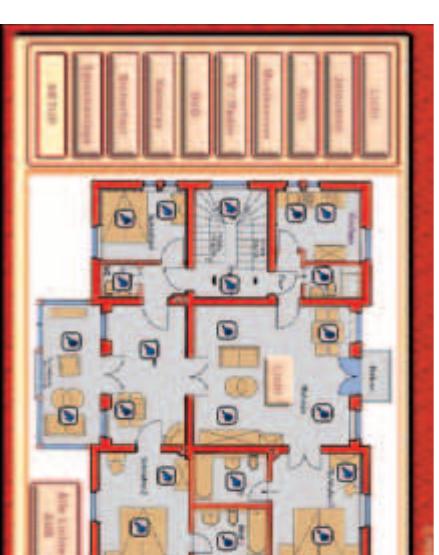
Touchpanel: Navigation links, Grundrissvisualisierung und Makro Beleuchtung

Die Frage des Nutzens ist immer in Verbindung mit den Ansprüchen, Gewohnheiten und Lebensumständen des Anwenders und damit nicht allgemeingültig zu beantworten. Untersuchungen und Gespräche mit Anwendern zeigen jedoch, dass der Mehrwert derartiger Systeme sich in der Regel über höheren Komfort, Sicherheitsaspekte und Einsparpotenzialen im Energiebereich definiert. Insbesondere die Verknüpfung von einzelnen Funktionen zu komplexen Abläufen, Zeitabhängige (nicht anwesenheitsabhängige) oder Ereignis abhängige Auslösungen solcher Bedienvorgänge und das Bilden von Regelkreisen in Abhängigkeit von An- oder Abwesenheit der Bewohner schaffen enorme Synergieeffekte. Der Einsatz solcher Automatisierungen lässt