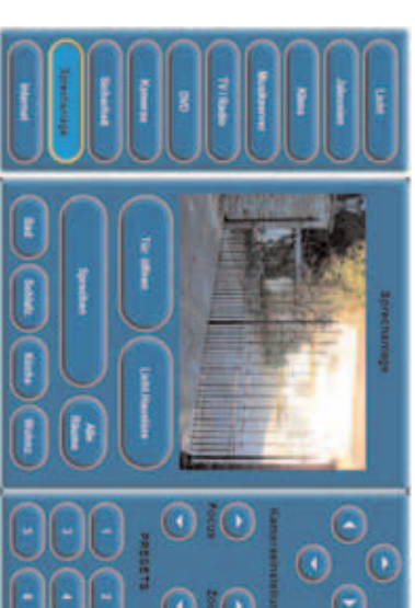
Einbautouchpanel mit Videoanschau der Türüberwachung

darüber hinaus erwarten, dass Senioren eine längere selbstständige Lebensführung ermöglicht wird, dass zeit- und kostensparenden e-learning-Techniken und home-Arbeitsplätzen zum Durchbruch verholfen wird.