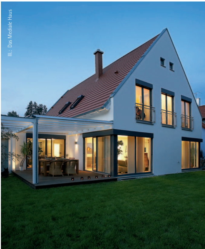
Ill.: Das Mediale Haus