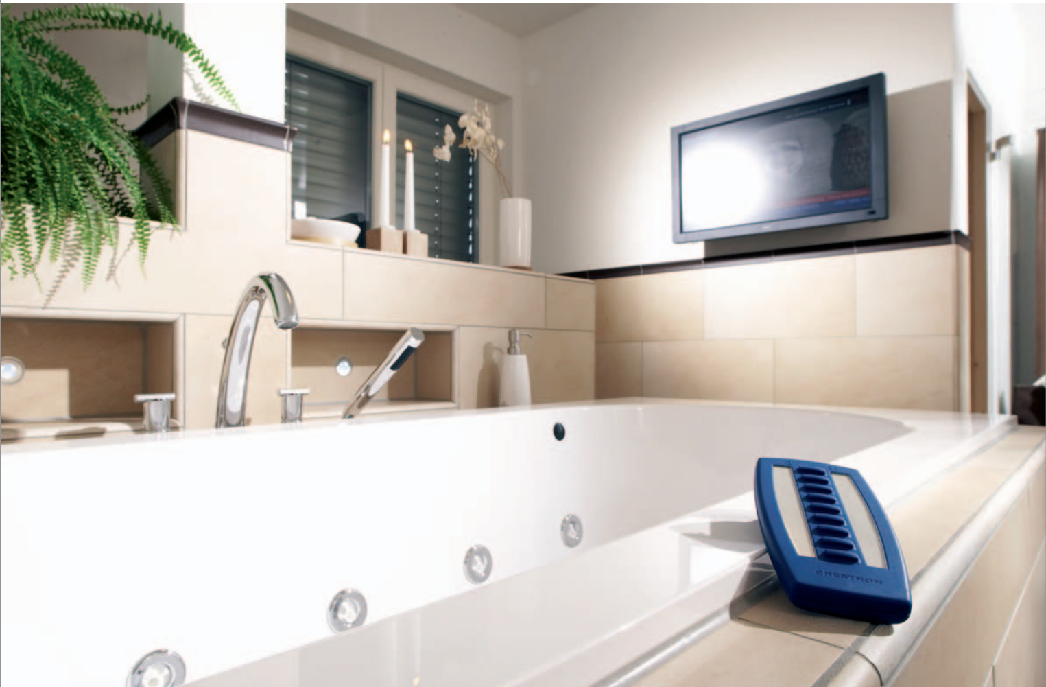
Das Touchpanel ist im Haus von Familie Krug immer in Reichweite: Ob im Wohnbereich (linke Seite), im Büro, in der Küche oder im Bad (unten) – Technik für den Menschen.