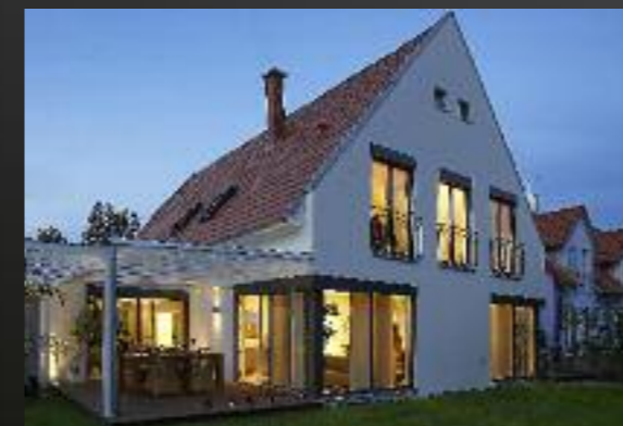
Abendstimmung: Wenn es dunkel wird, reagieren Beleuchtung und Rollläden automatisch.

Der Trend geht dahin, dass Produkte verschiedener Hersteller miteinander „kommunizieren“, etwa über den Funkstandard io-homecontrol. Die einzelnen Geräte sind kompatibel, das heißt, der Kunde kann am Ende Türen, Garage, Dachfenster, Heizung und Rollläden von einer einzigen Fernbedienung aus an-